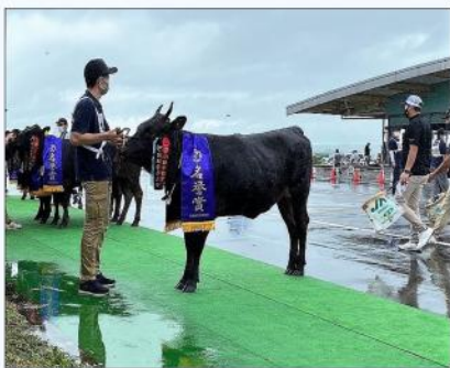
宮城県総合畜産共進会 (美里町)

さらに仙台空港まちづくり協議会の総会に出席しました。今後、顧問として岩沼市・宮城県・仙台国際空港と連携を図り、県と市の発展のために活動してまいります。