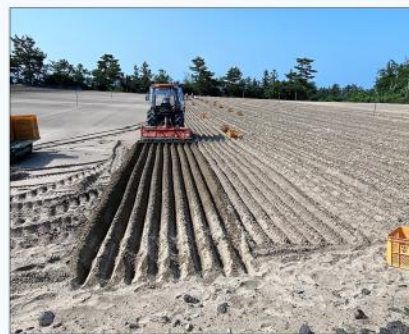
農林水産委員会で鳥取・島根県に県外視察。らっきょうの栽培・水産物(サバ・マス・アワビなど)の陸上養殖