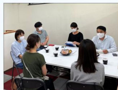
7月に開催した市内子育て世代との懇談会