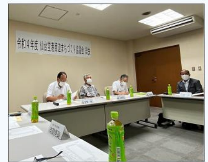
仙台空港周辺まちづくり協議会(岩沼市)